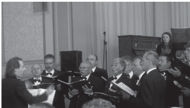
MGV Arion Saupersdorf