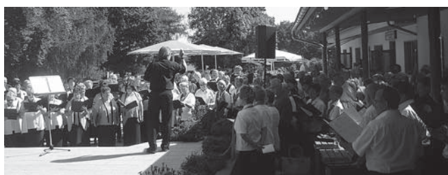
mit gemeinsamen Gesang wird das Sängertreffen eröffnet

Am Konzert nahmen 7 Chöre unseres Verbandes teil. Mit angepassten heiteren Dar-