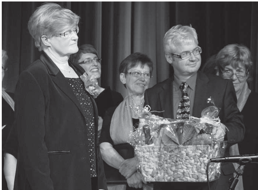
Gratulation und Glückwünsche von befreundeten Vereinen

Deutschen Chorverbandes in Gold. Mit dem Kammerchor Schneeberg hat sie ein umfangreiches Repertoire einstudiert, das vom Volkslied über Gospel, von neuen volkstümlichen Chorliedern bis hin zu erzgebirgischer und internationaler Chorliteratur reicht. Nach dem Festkonzert feierte man in geselliger Runde das Jubiläum