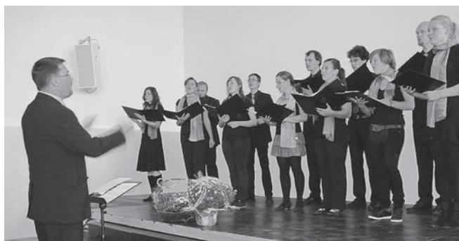
Auftritt der Harmonices Mundi zum Keplertag 2011.

bleibt seit Pythagoras bestehen und liefert in Keplers Werk "Harmonices Mundi" eine Harmonientheorie, die ausgeht von "weltbildenden Verhältnissen" - dem musikalischen Vermächtnis von Pythagoras. Kepler war der Auffassung, dass Alles von Gott in Perfektion geschaffen ward - das