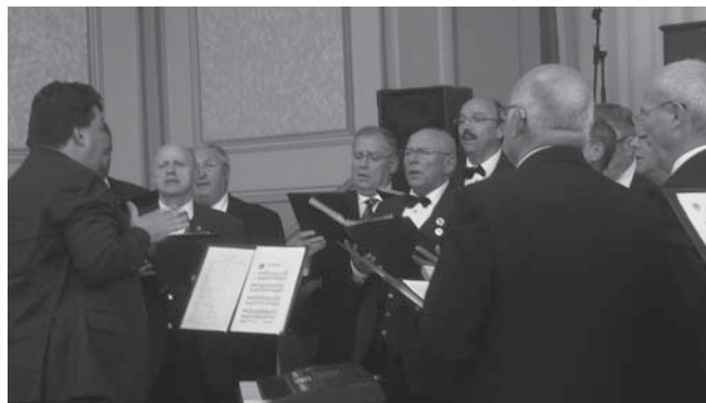
MGV Arion und MC Cäcilia bei gemeinsamem Gesang

Anlässlich der Feierlichkeiten der Stadt Kirchberg zu ihrem 800jährigen Bestehen fand im Rathaussaal Kirchberg am 22. September 2012 ein Chorkonzert mit dem MGVCäcilia Schiefbahn statt. Mitwirkende waren außerdem Solisten und der Jugendchor des Christoph-Graupner-Gymnasiums Kirchberg sowie die Bläsergruppe des Gymnasiums.