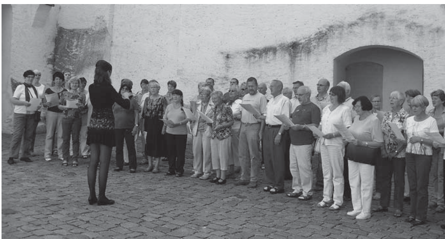
Gesangseinlage im Schloßhof