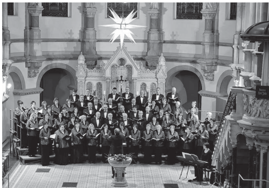
Der Polizeichor Dresden zum Weihnachtskonzert in der Martin Luther Kirche Dresden

cal- oder Schlagermelodien, bei denen sich die seit Jahrzehnten gepflegte Zusammenarbeit mit dem Polizeiorchester Sachsen bewährt.